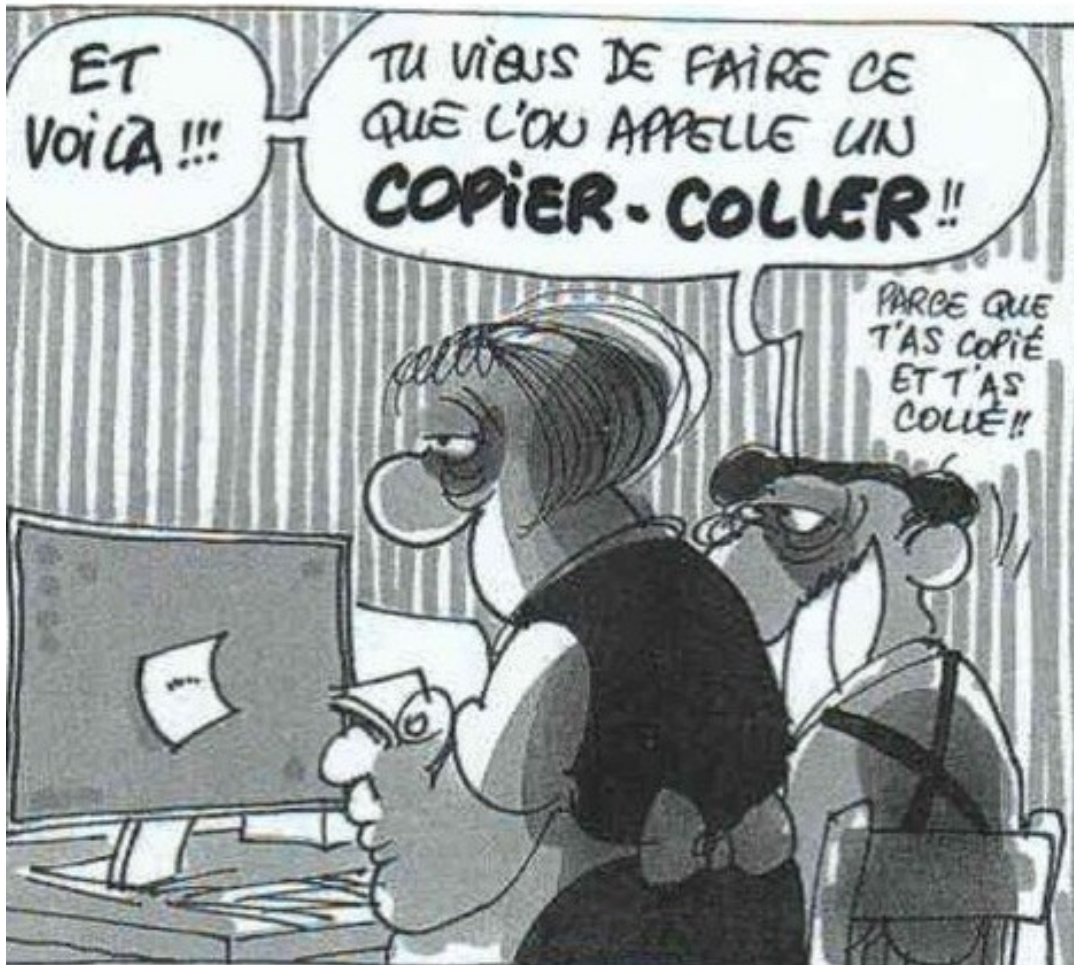
Les bidochons, « Les Bidochons internautes », Binet, 2008.

« Ça vous plait ? C'est moi qui l'ait fait ! »